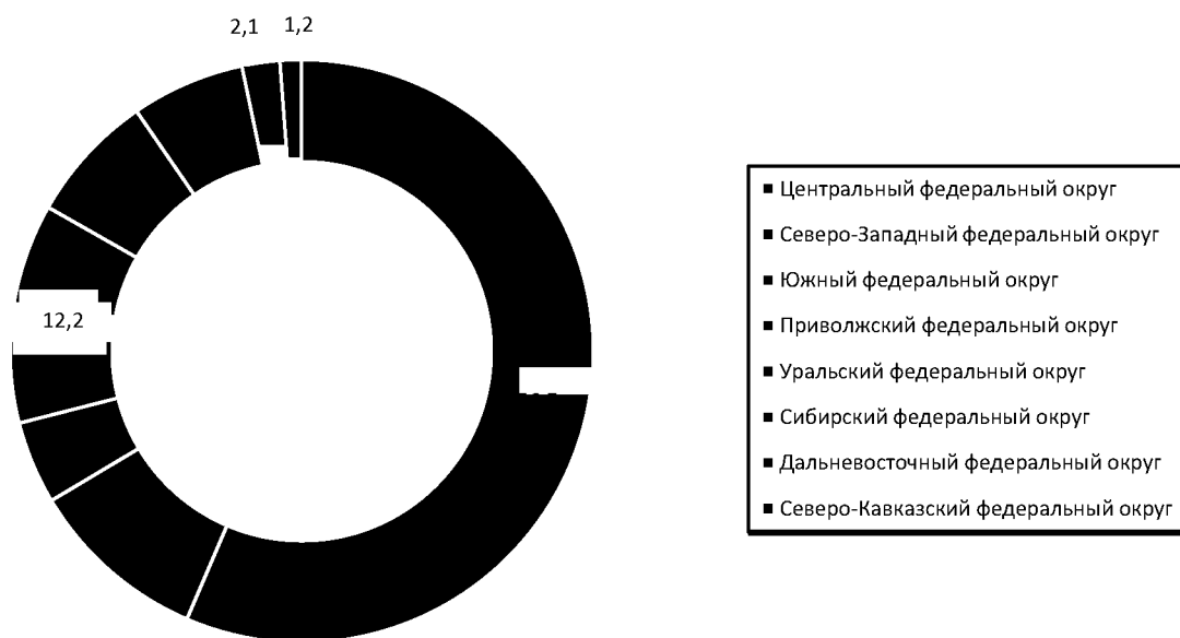
Рис. 1. Доля страховых премий в разрезе федеральных округов в 2012 году, %

Следует отметить, что индикаторы страхового рынка в 2012 году ниже, чем в предыдущие периоды. Доля страхования (без ОМС) в ВВП в 2012 году составила 1,3%, показатель с 2008 года имеет устойчивую тенденцию к снижению, в то время как в европейской практике этот показатель достигает среднего значения на уровне 7,7% (наименьшая глубина проникновения отмечается в Румынии – 1,44%). Сборы страховой премии на душу насе-